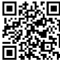
คู่มือการใช้งานระบบ DOAE Risk Map